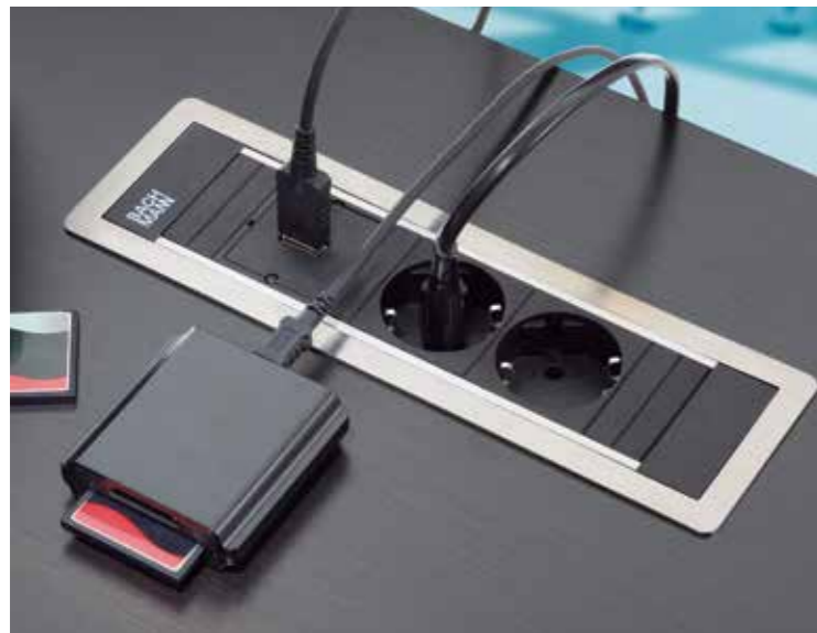
POWER BOX / POWER BOX / POWER BOX.