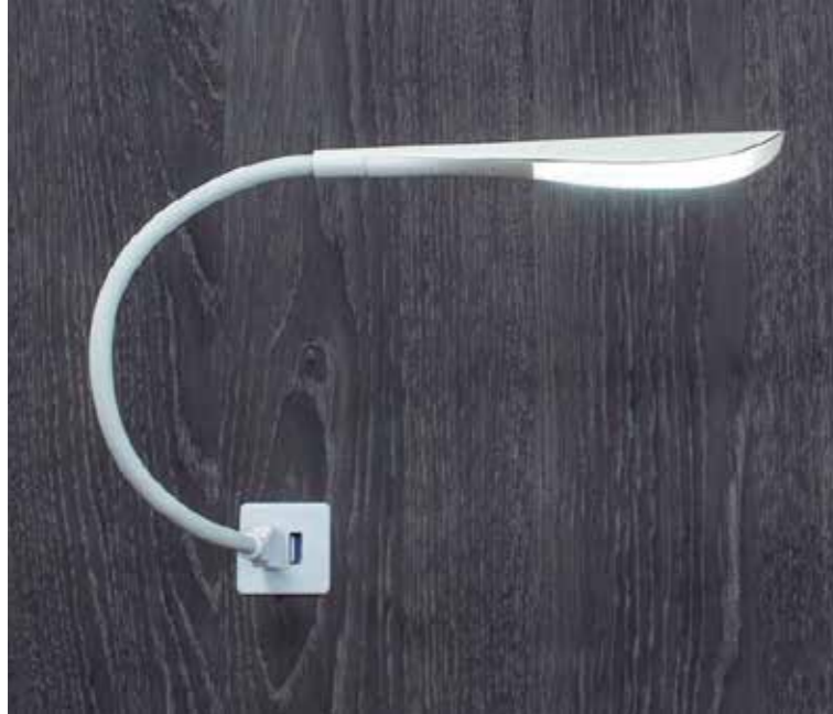
LAMPARA USB. USB LAMP. LAMPE USB.