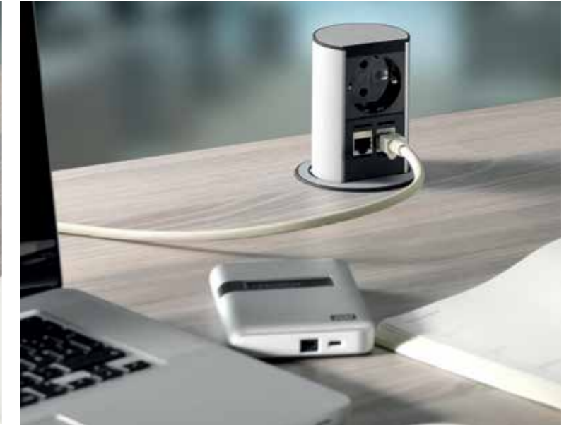
POWER BOX / POWER BOX / POWER BOX.