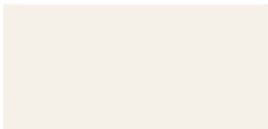
B Blanco Soft