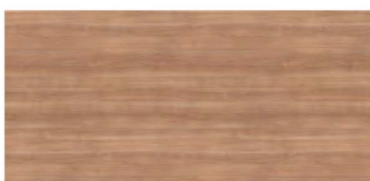
E Cerezo Ceniza