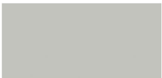
G Gris Claro