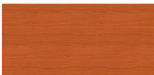
C Cerezo Claro