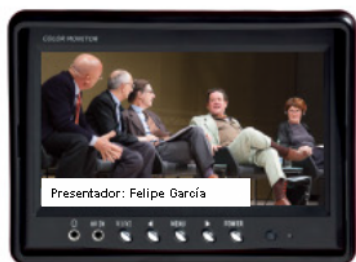
Reproducción en tiempo real

Anuncios, logos, patrocinadores... Las soluciones de la colección Multimedia ofrecen la oportunidad de transmitir anuncios de patrocinadores externos o de los usuarios / organizadores - un nuevo vehículo excepcionalmente eficaz con un bajo costo por contacto. Estos mensajes pueden ser transmitidos al comienzo de las reuniones o espectáculos, durante los intervalos y al final de las actividades o espectáculos. De esta manera, un lugar bien gestionado es capaz de generar ingresos sólo a través del patrocinio y llegar a ser más que suficiente para cubrir el alquiler del espacio.