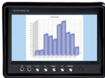
Integración con el tema principal