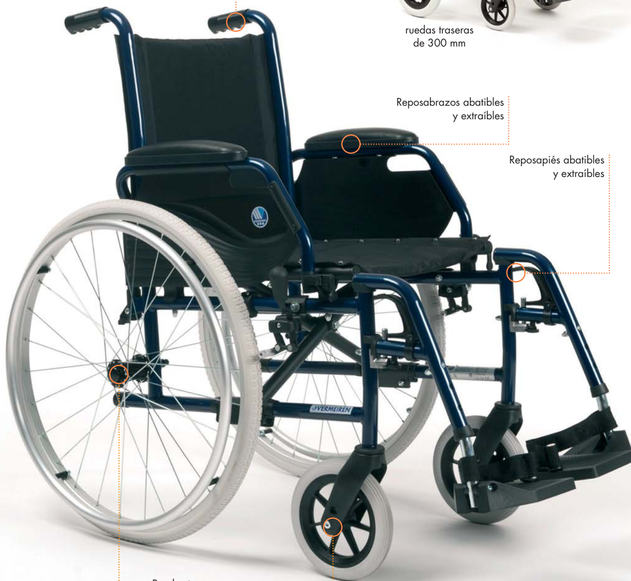
Ruedas traseras extraíbles