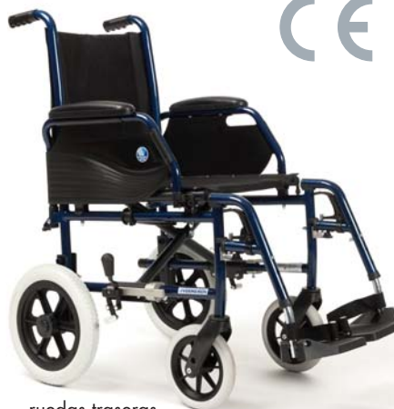
ruedas traseras de 300 mm

La silla JazzS50 es la solución económica, sin renunciar a los estándares de calidad más exigentes de la gama Vermeiren.