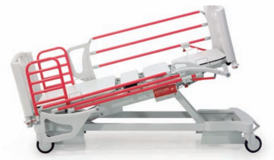
Trendelenburg / Antitrendelenburg: +16°

Barandillas laterales TOTAL PROTECT : ofrecen una protección perfecta frente a las caídas. Según normativa EN 60 601-2-52.