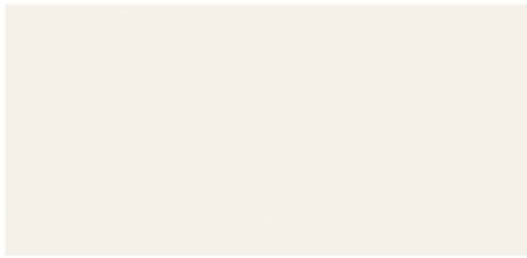
B Blanco Soft