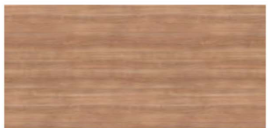
E Cerezo Ceniza