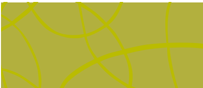
Dibujo del diseño del acabado de Plek