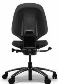
MEREO 200 NEGRO

La Mereo 200 tiene un respaldo medio y está equipada de serie con ruedas para suelos enmoquetados y base en aluminio lacado gris. También puede equiparse con reposabrazos.