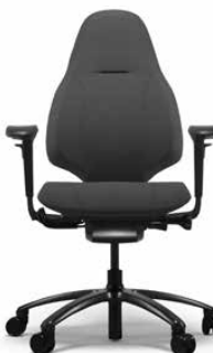
MEREO 220 NEGRO

La Mereo 200 tiene un respaldo medio y está de serie con ruedas para suelos enmoquetados y base en aluminio lacado negro. También puede equiparse con reposabrazos.