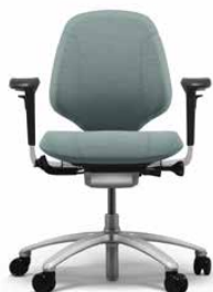
MEREO 200 PLATA

La Mereo 200 tiene un respaldo medio y está equipada de serie con ruedas para suelos enmoquetados y base en aluminio lacado gris. También puede equiparse con reposabrazos.