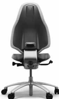
MEREO 220 PLATA

La Mereo 220 tiene un respaldo alto y está equipada de serie con ruedas para suelos enmoquetados y base en aluminio lacado negro. También puede equiparse con diversas opciones tales como reposacabezas, reposabrazos y percha.