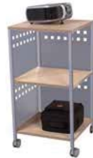
Medidas / Sizes (cm)