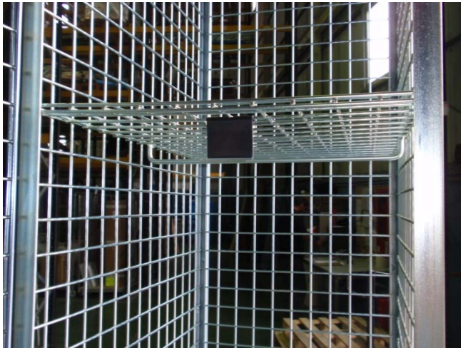
Estante fijo con barra porta-perchas y etiquetero