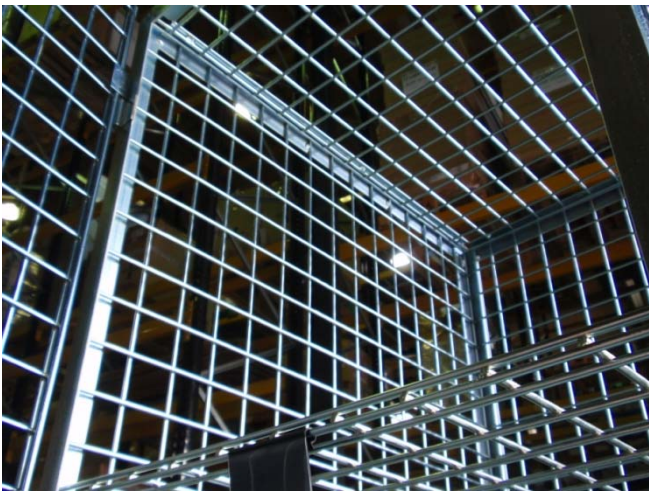
Detalle puerta, techo y laterales