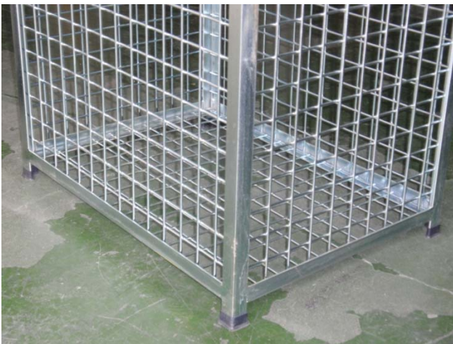
Detalle posterior de la base con patas