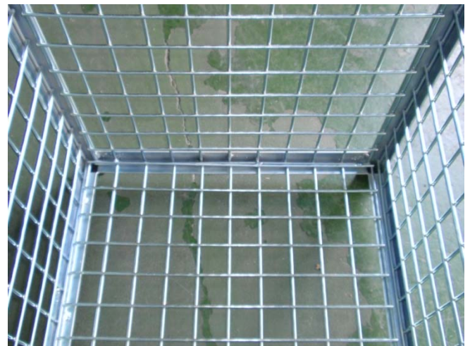
Detalle interior de la base