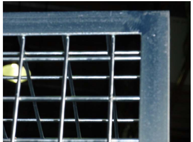
Detalle estructura perimetral