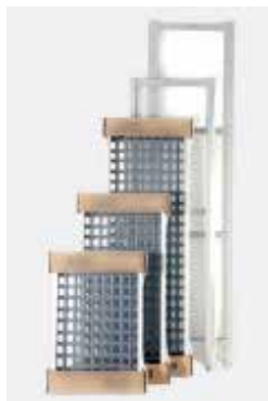
Detalle soporte ángulo Detail of Corner ass

NOTE: For other dimensions in length and/or depth, please inquire