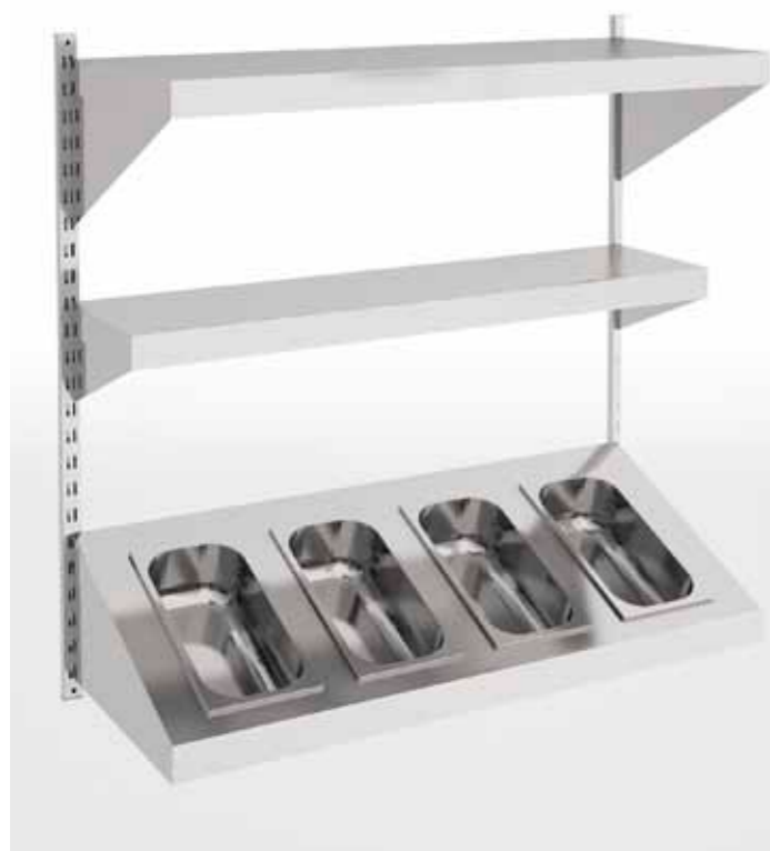
Recipientes gastronorm no incluidos