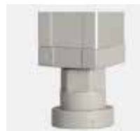
Pata regulable Adjustable leg