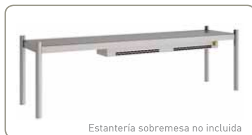
Estantería sobremesa no incluida