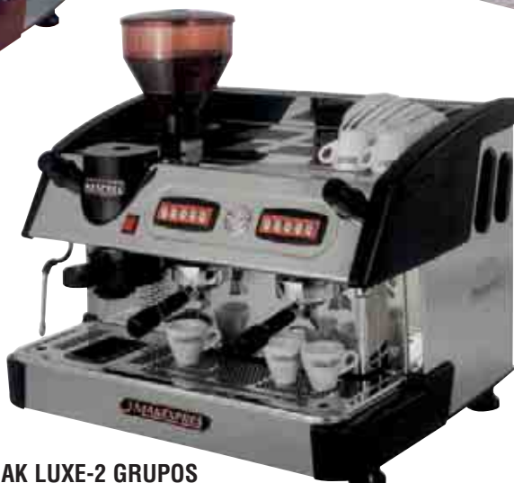
MAK LUXE-2 GRUPOS CON MOLINO