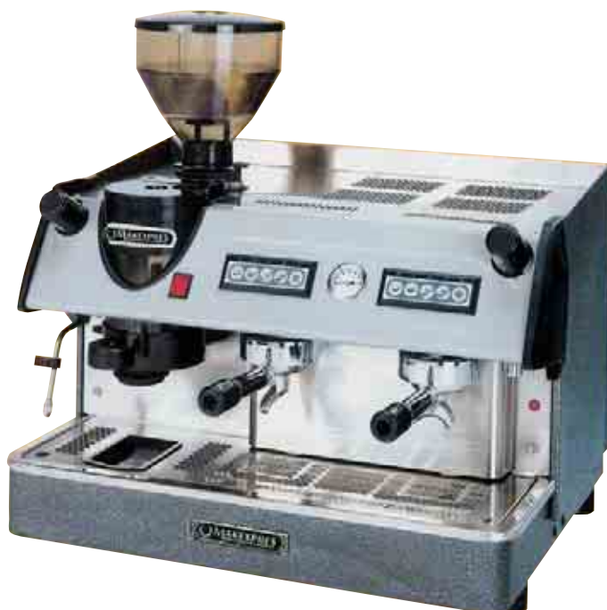
MAK-EC- 2 GR. ELECTRÓNICA CON MOLINO INCORPORADO AUTOMÁTICO