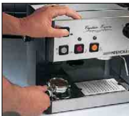
MOLIDO AL INSTANTE