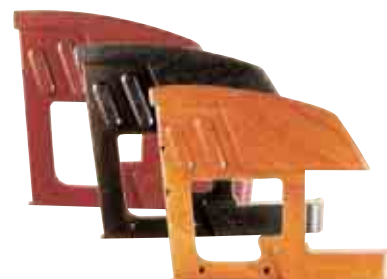
LATERALES MAK LUXE