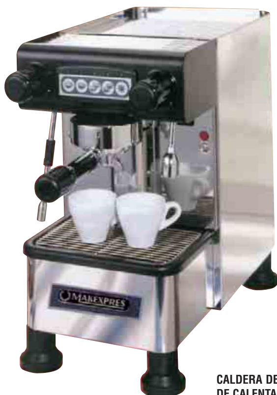
MAK-EXPRES-1-G-CONTROL-ELECTRONICA CON DEPÓSITO