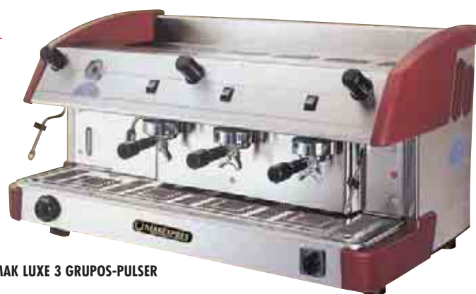
MAK LUXE 3 GRUPOS-PULSER