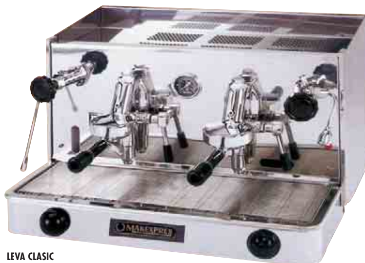
LEVA CLASIC EB-2-GR