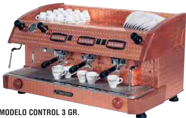
MODELO CONTROL 3 GR. MADERA Y COBRE ADAMASCADO