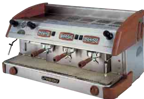
MAK LUXE-3-GR-ELECTRÓNICA CON KIT DE MADERA