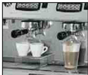
9- OPCIÓN ADAPTACIÓN A VASO ALTO