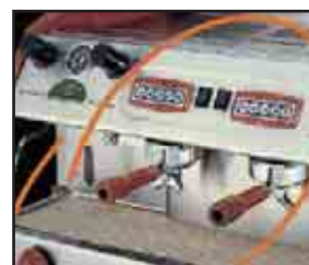
3- OPCIÓN KIT DE MADERA