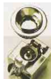
MUELAS PLANAS DE ACERO ESPECIAL TEMPLADO