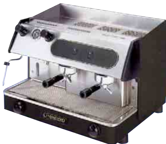
INTER-2 GRUPOS PULSER