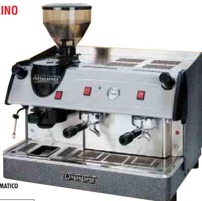
MAK-EC- 2 GR. CON MOLINO AUTOMÁTICO