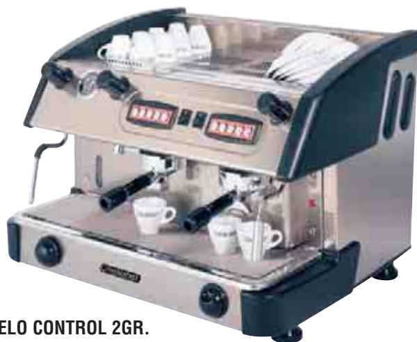
MODELO CONTROL 2GR. CARBONO CON LANZA ESPUMA-LECHE