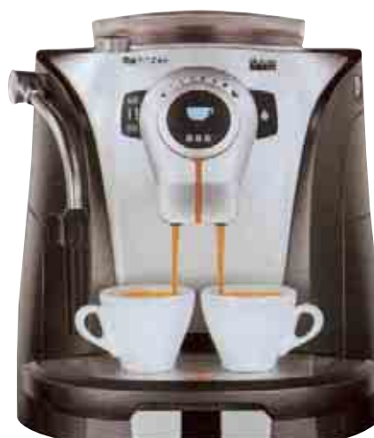
ODEA - GIRO BASE GIRATORIA 360°