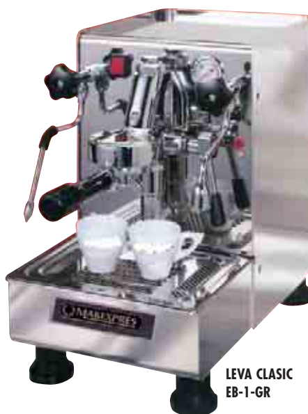
LEVA CLASIC EB-1-GR

1 Porta-cacillo + 1 muelle + 1 cacillo 1 taza + 1 cacillo 2 tazas + 1 salida 2 tazas + 1 prensa café + 1 cucharilla dosificadora de café.