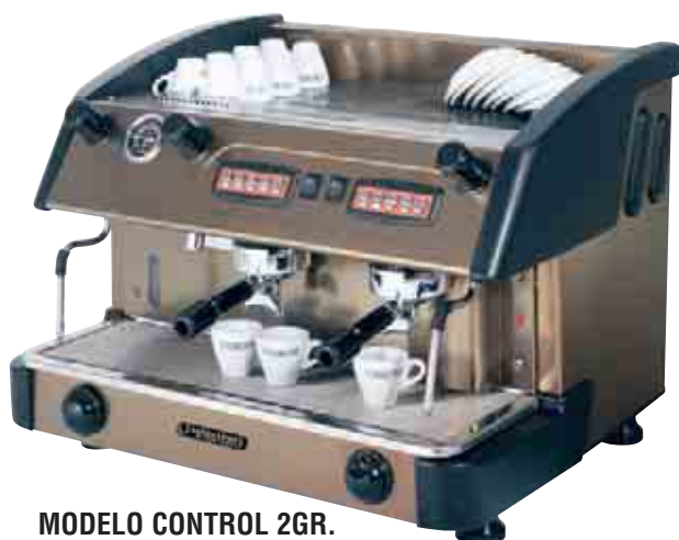
MODELO CONTROL 2GR. DUNA ORO