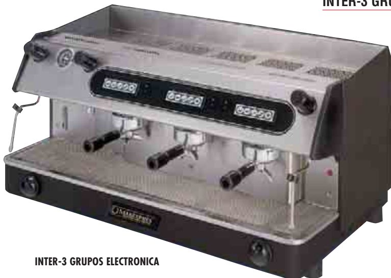
INTER-3 GRUPOS ELECTRONICA