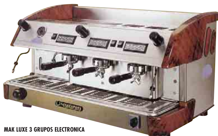
MAK LUXE 3 GRUPOS ELECTRONICA