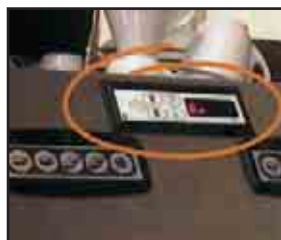
6- OPCIÓN CENTRAL-PROGRAM