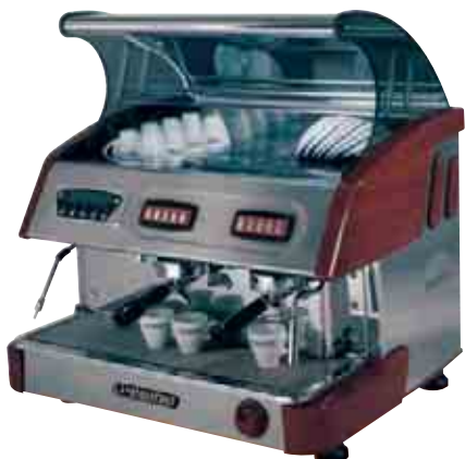
OPCIÓN CON CALIENTATAZAS