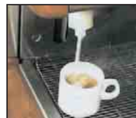
4- OPCIÓN CAPUCINADOR