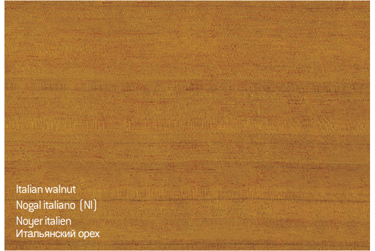
Italian walnut Nogal italiano (NI) Noyer italien Итальянский орех