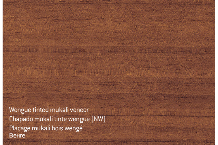
Wengue tinted mukali veneer Chapado mukali tinte wengue (NW) Placage mukali bois wengé Венге