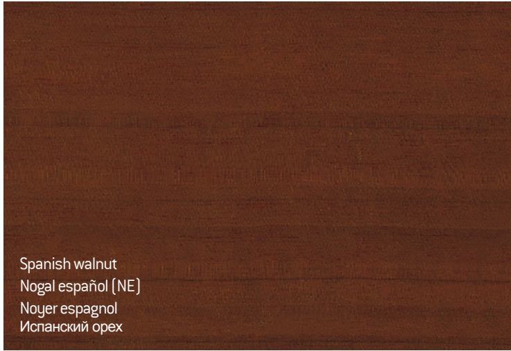
Spanish walnut Nogal español (NE) Noyer espagnol Испанский орех